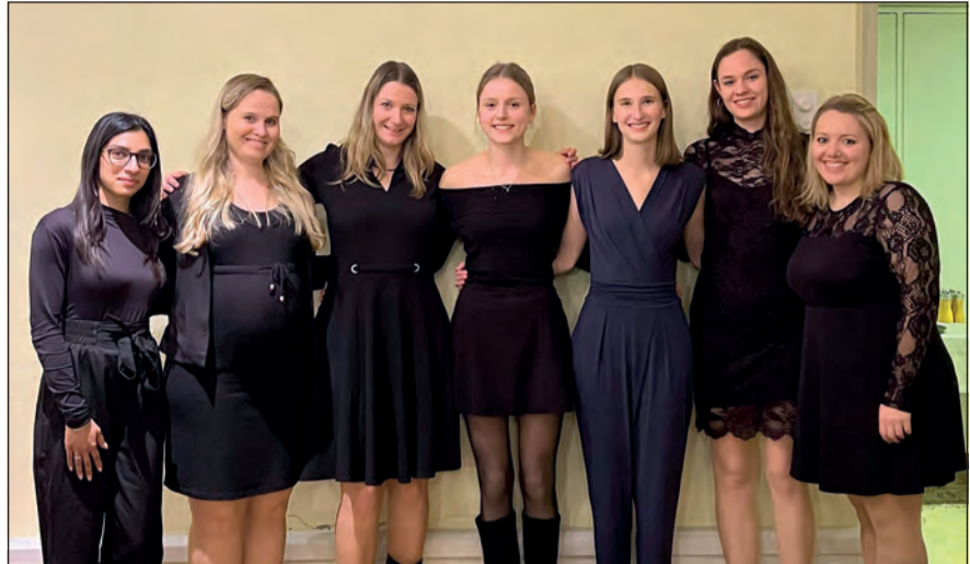
Der gesamte Vorstand wurde wiedergewählt

Am Freitag, 21. Februar 2025, fand die 104. Generalversammlung des Damenturnvereins Erlinsbach SO im Landhotel Hirschen in Erlinsbach statt. Die traditionsgemäss durchzuführenden Geschäfte verliefen reibungslos. Besonders erfreulich ist, dass sich der gesamte Vorstand zur Wiederwahl stellte, wir drei neue Leiterinnen wählen durften und das Kinder- und Jugendangebot im vergangenen Jahr um eine weitere Riege, das Kinderakrobatik, gewachsen ist.