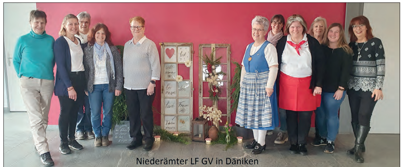
Niederämter LF GV in Däniken

Am 22. Januar hielt der Landfrauenverein Niederamt seine 93. Generalversammlung in der Bühnhalle in Däniken ab.