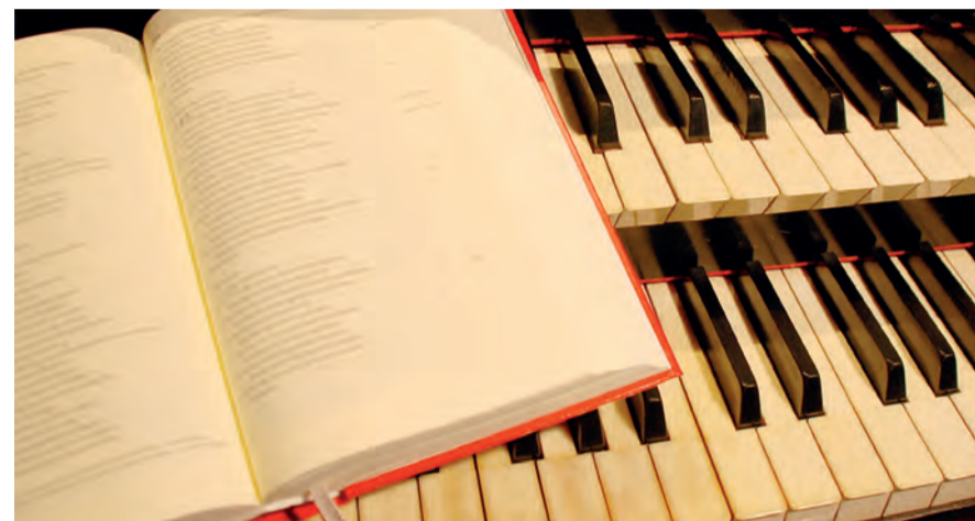
Musik & Wort – Orgeltasten und Bibel in der Kirche

3. Advent, 15. Dezember 2024, 17 Uhr in der reformierten Kirche Erlinsbach