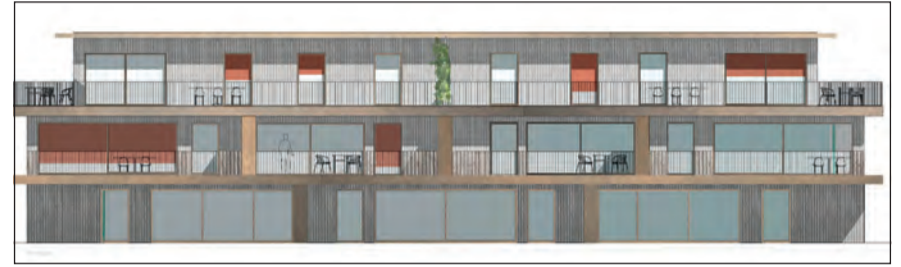
Projekt MFH im Unterschachen

Am 22. November 2021 wurde durch den Souverän ein Kredit von Fr. 180'000.00 gesprochen für die Planung eines Mehrfamilienhauses im Unterschachen. Bedingt durch die Ortsplanrevision konnte die Planungsphase erst verzögert angegangen werden. Nach Abschluss der Planung durfte nun der Versammlung aber ein gelungenes und schönes Projekt vorgestellt werden mit insgesamt 9 Wohnungen, wovon zwei 2.5-Zimmer, fünf 3.5-Zimmer und zwei 4.5-Zimmer-Wohnungen. Für die von den Architekten C2M, Olten, ermittelten Baukosten im Gesamtbetrag von Fr. 4'950'000.00 wurde der Versammlung die entsprechende Kreditfreigabe beantragt. Das Projekt wurde vom Gemeindepräsidenten Patrick Friker im Detail erläutert und gab zu keinen Diskussionen Anlass. Der Souverän stellte sich hinter das Projekt und stimmte der Kreditfreigabe einstimmig zu, womit nun der