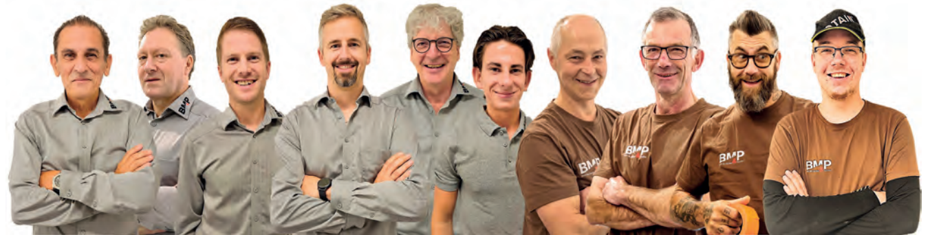
Das aufgestellte Team der BM&P AG.

... und erfolgreich ist dieses Team seit über 30 Jahren unterwegs. Immer wieder wurden junge Talente in diese Mannschaft geholt und durften das Team verstärken und weiterentwickeln. Kein Wunder, dass da die Freude an der Arbeit alltäglich vorhanden ist. Diese gute Stimmung wird natürlich auch von der langjährigen, treuen Kundschaft mitgeprägt. Aktuell liegt das Durchschnittsalter bei 48 Jahren. Alle Erfahrungsjahre dieser Mitarbeiter betragen summiert stolze 150 Jahre. Immer wieder darf das erprobte