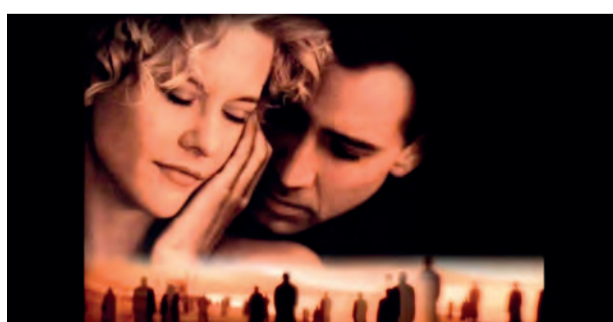
Engel Seth und die Ärztin Maggie kommen sich näher.

Ärztin Maggie aufmerksam, die am Tod eines Patienten zu verzweifeln droht. Seth verliebt sich unsterblich in die aussergewöhnliche Frau, doch bevor seine Träume sich erfüllen können, muss er für immer auf sein Dasein als Engel verzichten.