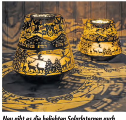
Neu gibt es die beliebten Solarlaternen auch mit Wintermotiven.