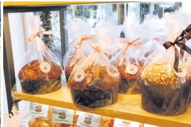
Beim Ängelbeck entstehen Weihnachtsköstlichkeiten wie Panettone in traditioneller Herstellungsweise.