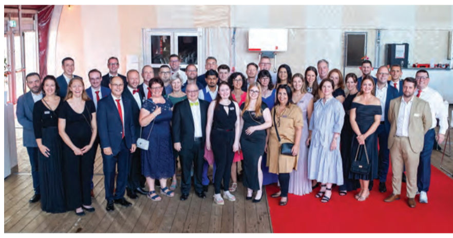
Das Team der Raiffeisenbank Mittlegösgen-Staffelegg am Gala-Abend

Die Raiffeisenbank Mittlegösgen-Staffelegg feierte am Wochenende vom 30. August bis 1. September mit rund 2500 Personen ihr 100-jähriges Bestehen mit einem grossen Jubiläumsfest und lud die komplette Region ein, mitzufeiern. Von Freitag bis Sonntag war «DAS ZELT» in Obergösgen der Treffpunkt, an dem die Bank eine Vielzahl von Veranstaltungen für jede Altersgruppe durchführte.