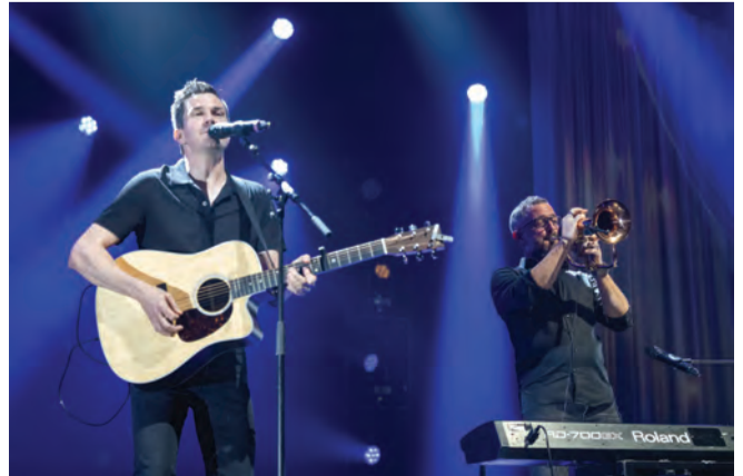
Popduo MACY aus Winznau und Lostorf