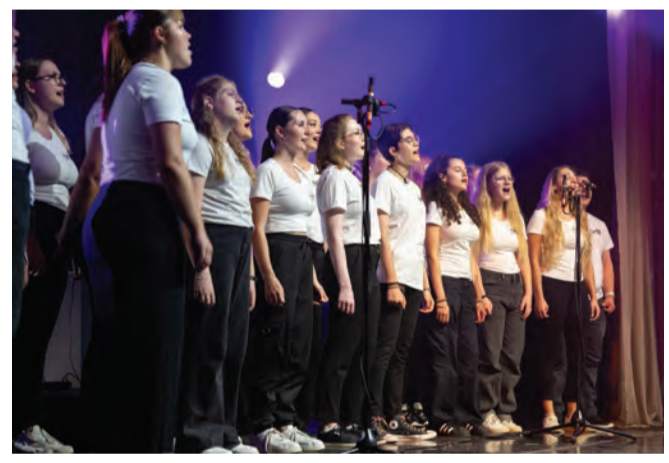
Verein Jugendchor Speuz