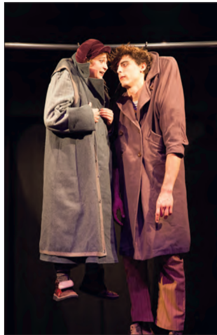
Les Diptik, Hang up

Nach dem Kulturgenuss geht's weiter beim Apéro