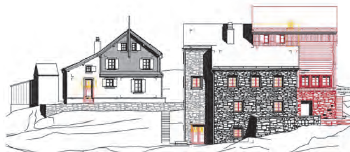
Ansicht Süd-West, Anpassungen rot

Das Architekturbüro ARGE HuberHutmacher Architektur, Bern hat ein eindrückliches Projekt erarbeitet.