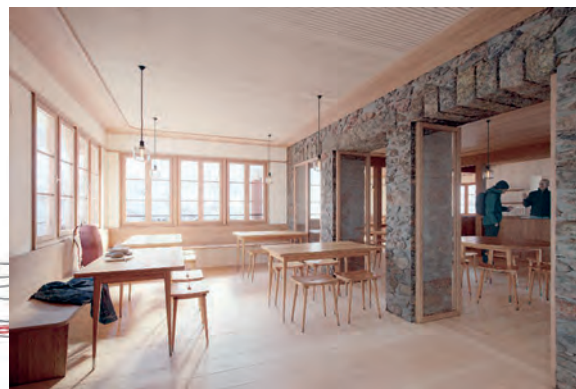
Innenraum der Gaststube

Ziel ist es, die Infrastruktur zu verbessern, die Bausubstanz nachhaltig zu sanieren und eine teilarke Energieversorgung aufzubauen. Die Umsetzung soll grösstenteils 2026 erfolgen.