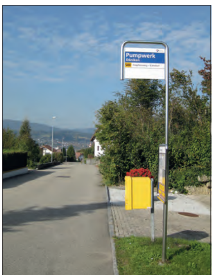
Däniker Ortsbus bleibt erhalten!

Die Firmen Planzer Transport AG wie auch die Kernkraftwerk Gösgen-Däniken AG haben einen Beitrag von je CHF 5000 für die verbesserte Wirtschaftlichkeit des Ortsbusses für die nächsten drei Jahre zugesichert. Der Gemeinderat freut sich sehr über die Unterstützung dieser beiden grossen Arbeitgeber in Däniken und bedankt sich bestens. Sie leisten einen wichtigen Beitrag zur Erhaltung des Däniker Ortsbusses. Zudem wird damit der aktuell fehlende Betrag zur Erreichung