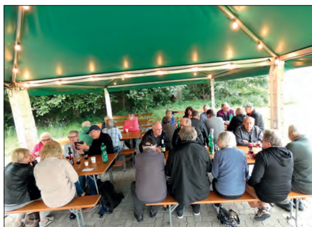
Blick in die Runde