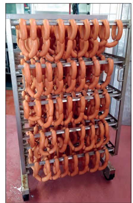
Lecker: So sehen «Siegerwürste» aus (Foto: zVg).