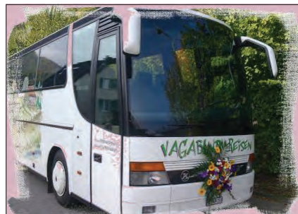
17 Jahre Vagabund Reisen