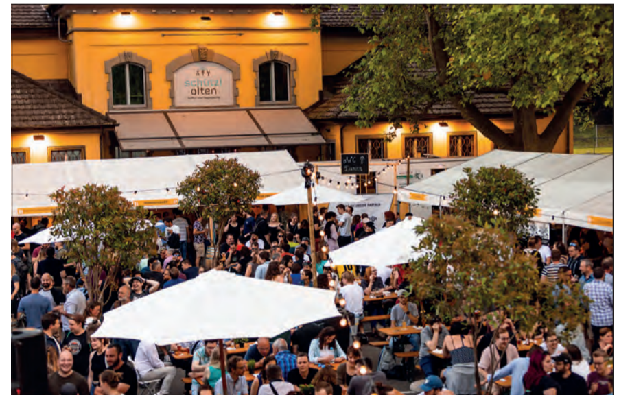
Im Schatten der Bäume und im Schein der Lichterketten: der Biergarten mit Charme vor der Schützi.

Gut zu wissen: Neben einer grossen Auswahl an Bieren erwarten die Gäste auch ein Foodstand mit einem grösseren Angebot, sowie eine Mineralbar mit Zweifel-Chips. Dank der erneuten Zusammenarbeit mit Eptinger steht hier das Wasser für zwischendurch wieder gratis zur Verfügung. Neben Wasser stehen aber selbstverständlich auch die bekannten Softgetränke im Kühlschrank. Und für die, die vor allem als Begleitung von Bierliebhaber:innen anreisen, werden auch Wein und Prosecco gekühlt.