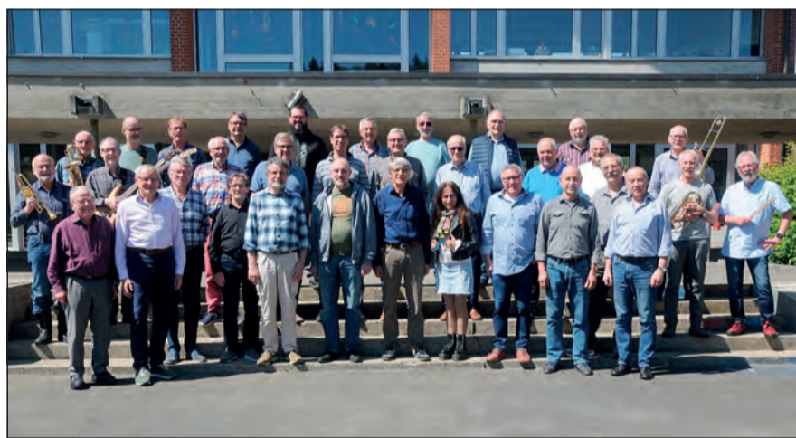
Der Männerchor Kappel präsentiert sich mit seinen musikalischen Unterstützern.