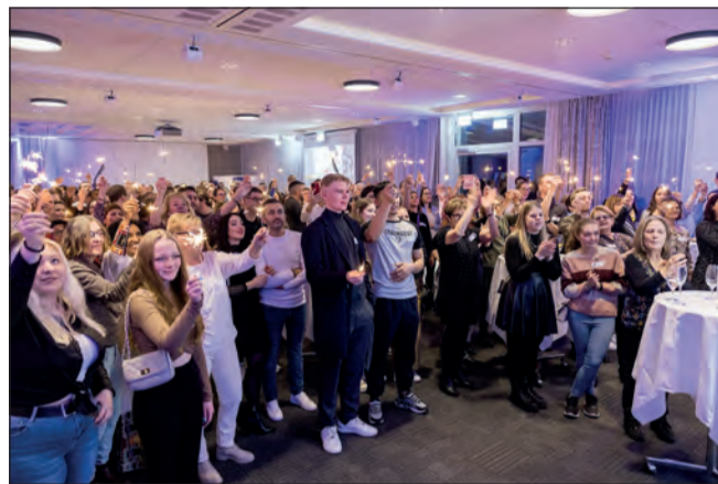
Aktuelle und ehemalige Mitarbeitende (Gäste)