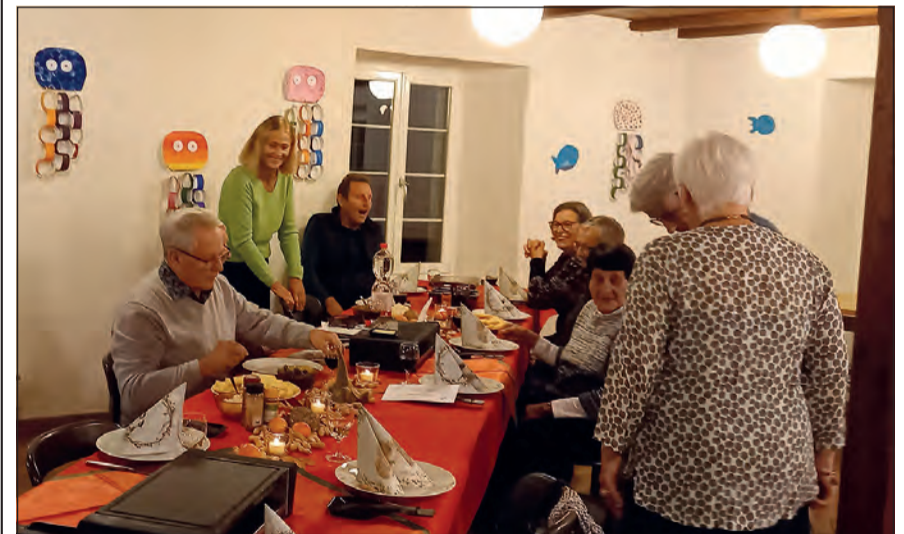
Ein feines Raclette nach der Versammlung