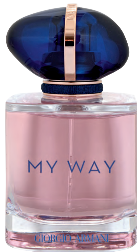
«Giorgio Armani My Way EdP 50 ml» gibt's bei OTTO'S deutlich günstiger als bei den meisten bekannten Parfümanbietern.

Übrigens: Die Markenparfüms und Pflegeprodukte sind auch im Online-shop unter www.ottos.ch erhältlich.