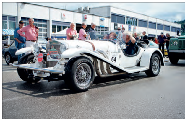
Oldtimer am OGP 2022

Eintauchen, staunen und geniessen – dazu lädt seit über dreissig Jahren der Oldtimer Grandprix Safenwil ein. Der weit herum bekannte Event findet heuer zum 31. Mal statt und ist ein Publikumsmagnet.