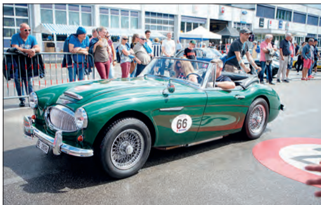
Oldtimer am OGP 2022

Besitzer und Liebhaber von Oldtimern treffen sich am Samstag, 19. August 2023, zum 31. Mal auf dem Areal der Emil Frey AG in Safenwil zum Oldtimer Grandprix. Am einzigartigen Event können die Besucher die Raritäten auf der Strecke oder auf dem Areal geniessen und bestaunen und in Nostalgie schwelgen.